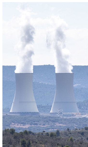
Panorámica de la central.

El pasado 18 de abril la Central Nuclear de Trillo alcanzó una producción acumulada de 250.000 millones de kilovatios/hora desde el comienzo de la operación comercial, un proceso que tuvo lugar, en concreto, el día 6 de agosto del año 1988. Asimismo, la planta acumula ya casi 12 años consecutivos sin paradas automáticas del reactor desde la última registrada en junio de 2007.