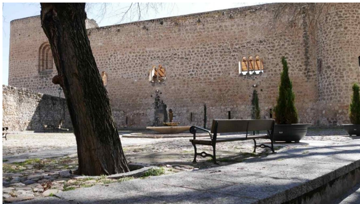
El castillo de la Peña Bermeja será uno de los monumentos que podrán visitarse de manera gratuita.

Pero no sólo eso. La villa briocense acogerá un mercado artesano – desde la Puerta de la Cadena hasta la plaza de Herradores –, varios pasacalles, conciertos y una ruta de la tapa por los bares del municipio para degustar en pequeños bocados los sabores de la tierra. En esta ocasión,